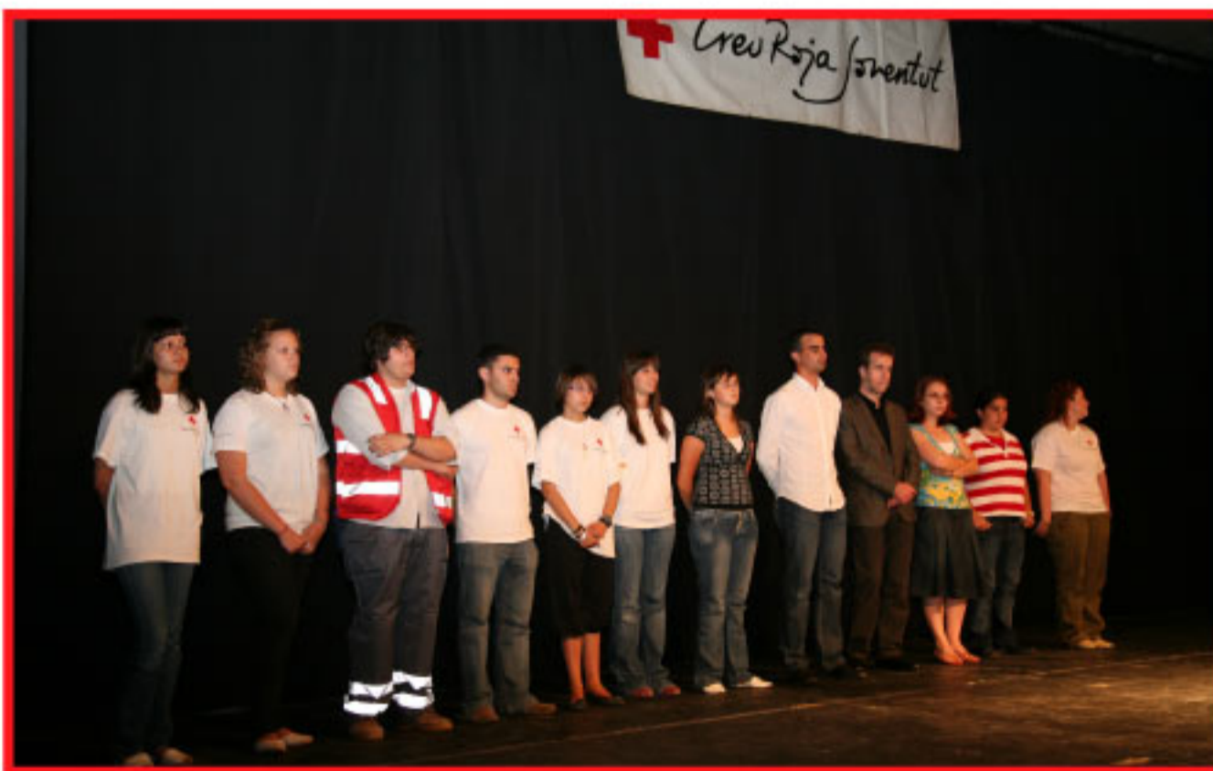
Imatge de la VI Gala Solidària de la Creu Roja Joventut que va servir per recaptar fons per al projecte que realitzen a Equador

i Pol. L'activitat va comptar amb la col·laboració de diverses entitats de la població i del voluntariat de l'associació. A més, una part del pressupost de l'Assemblea local de Sant Joan Despí es destina a la causa. Per portar a terme aquest projecte s'implantaràn processos de recuperació i sistematització de les pràctiques i sabers ancestrals relacionats amb la salut i l'harmonia amb l'entorn. A la pràctica, això comporta l'adequació de 17 centres de ritualitat, formacions d'agents de salut tradicionals, sistematització del coneixements existents i l'implantació d'una farmàcia viva per al processament i la comercialització de fitofàrmacs.